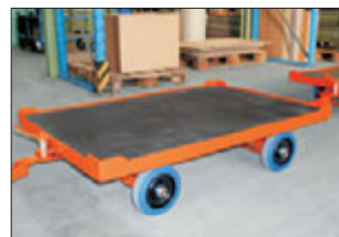
Anhänger mit spursicherer Achsschenkel-Lenkung.