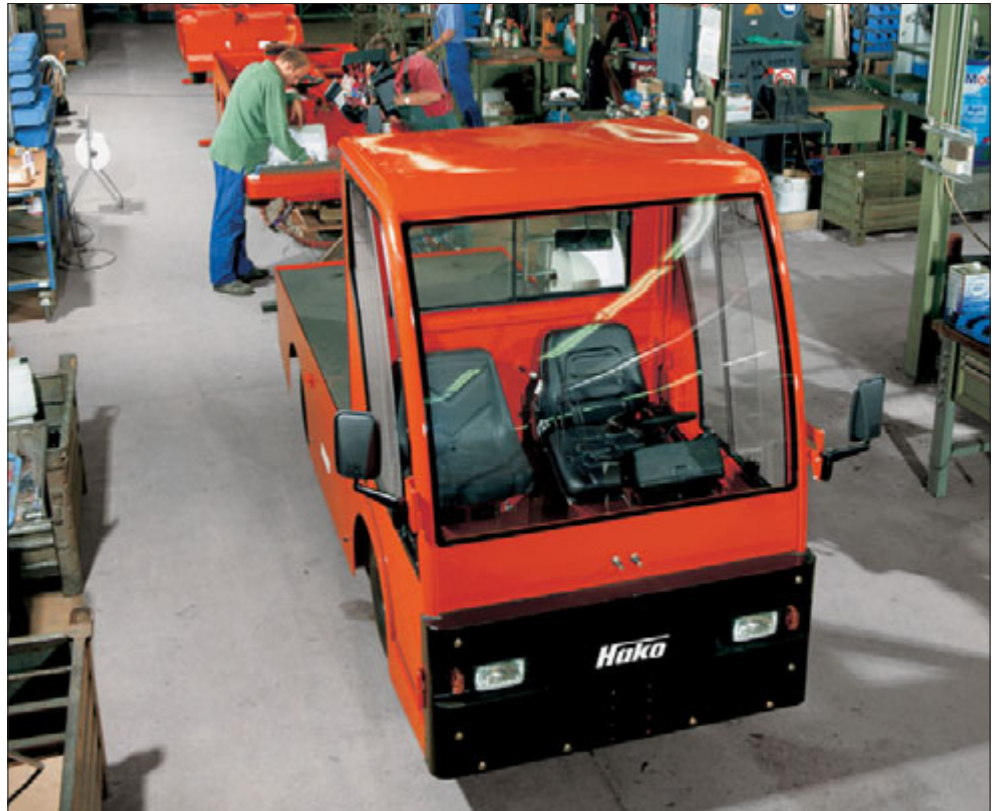
Serienfertigung in einer der vielseitigen Taktstraßen im Hako-Zweigwerk HMB in Glindow bei Potsdam.