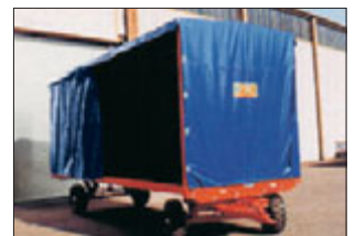
Anhänger mit Drehschemel-Lenkung.