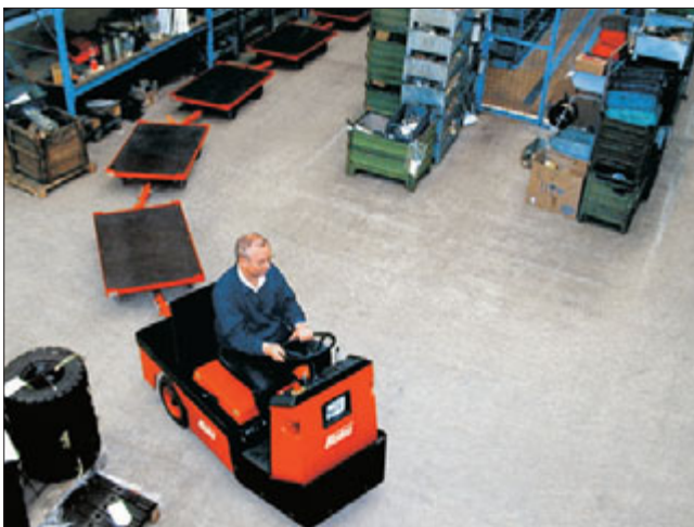
"Kettenreaktion" – für spezielle Transportaufgaben.