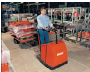
Hako-Sherpa 1.500 ST

Anhängelast: 1.500 kg Fahrgeschwindigkeit: 10 km/h Motorleistung: 2 kW