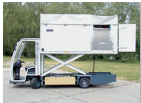
Hako-Cargo Sonderfahrzeug mit hydr. Hebebühne

Technische Daten Zuladung: bis zu 2.000 kg Anhängelast: 2.000 kg Fahrgeschwindigkeit: 16 km/h Motorleistung: 4,5 kW