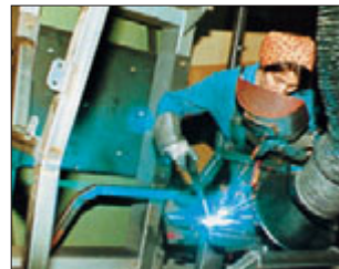
Flexibles Zentrum für MAG- und Punktschweißarbeiten.