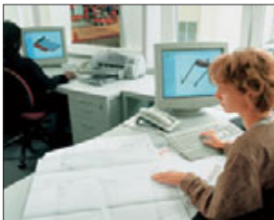
Alles in einer Hand, von der Konstruktion bis zur Fertigung.