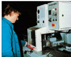
Metallverarbeitungszentrum für Profile, Rohre und Bleche.