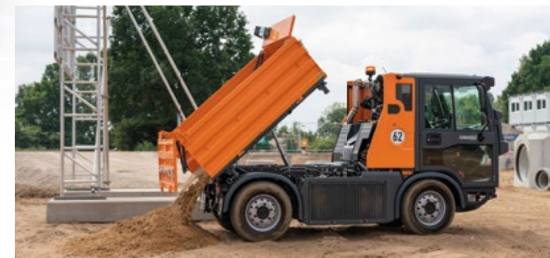
Serienmäßig auf Flexibilität ausgelegt: die Schnellwechselsysteme des Multicar M29. Im Bild: robustes Geräterieck für Frontgeräte.