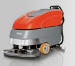
Scrubmaster B90 CL