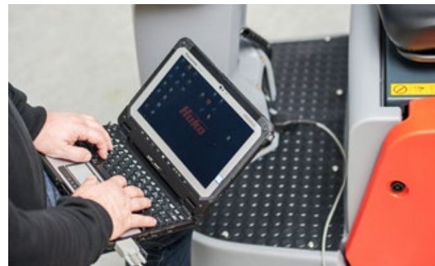
Einfacher Zugang zur Diagnose-Schnittstelle für Wartung und Modifikation von Fahreinstellungen.

Für mehr Flexibilität und Wirtschaftlichkeit bieten wir Ihnen attraktive Miet- und Leasingoptionen – optimal abgestimmt auf Ihren Bedarf.