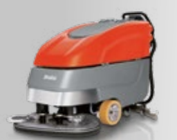
Scrubmaster B90 CL