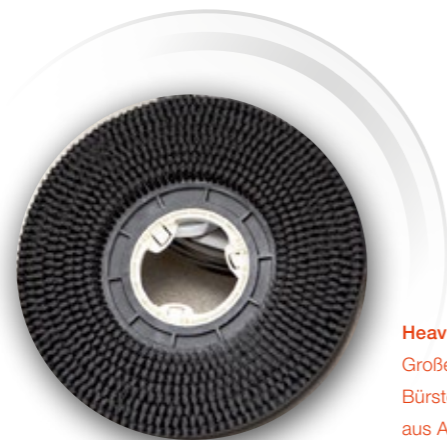
Heavy-Duty-Auslegung Große Zuverlässigkeit dank Bürstenaggregat und Saugfüßen aus Aluminium-Druckguss.