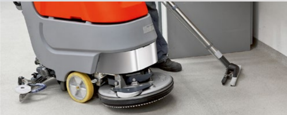
Flächenleistung bis 2.900 m 2 /h