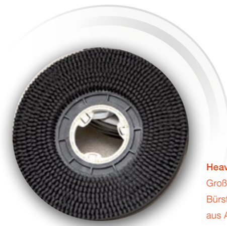
Heavy-Duty-Auslegung Große Zuverlässigkeit dank Bürstenaggregat und Saugfüßen aus Aluminium-Druckguss.