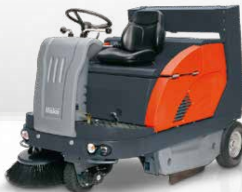
Sweepmaster P1200 RH