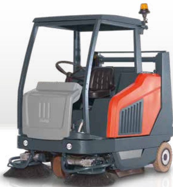
Sweepmaster B1500 RH avec option: le toit de protection