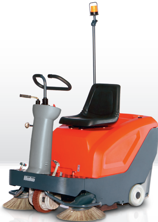
Sweepmaster B800 R