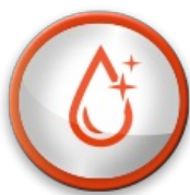
Nettoyage à l'eau